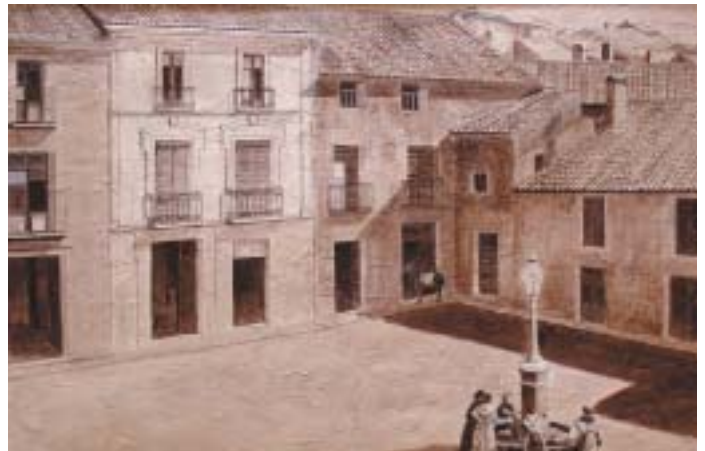
EL PINOSO ANTIGUO EN UNO DE LOS TRABAJOS EXPUESTOS