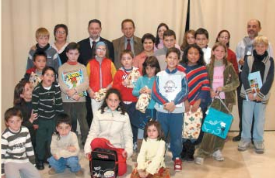
NIÑOS PREMIADOS, MIEMBROS DE FENT CAMÍ Y AUTORIDADES LOCALES

Con motivo del Día Internacional del Discapacitado, que se celebraba el pasado 3 de diciembre, la asociación de discapacitados de Pinoso y comarca "Fent Camí" entregó, en la víspera de la celebración, los premios de un concurso de dibujo que, con el título de "Per un món sense barreres des de la mirada d'un xiquet", organizó para implicar a los alumnos de los colegios públicos de Pinoso, San Antón y Santa Catalina, en la concienciación ciudadana respecto de las personas que padecen alguna discapacidad física, psíquica o sensorial.