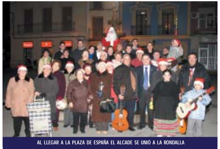
AL LLEGAR A LA PLAZA DE ESPAÑA EL ALCALDE SE UNIÓ A LA RONDALLA

No cabe duda que en las fiestas de Navidad tiene una gran importancia la música, y sobre todo el canto de los populares villancicos. En la noche del 22 de diciembre, recuperando una tradición muy arraigada, la rondalla-coral “Monte de la Sal” salió por las calles de Pinoso a pedir el “aguinaldo”, que es como se llama por aquí al aguinaldo. Aquellas personas que les abrieron sus puertas recibieron como compensación un pequeño concierto de música navideña.