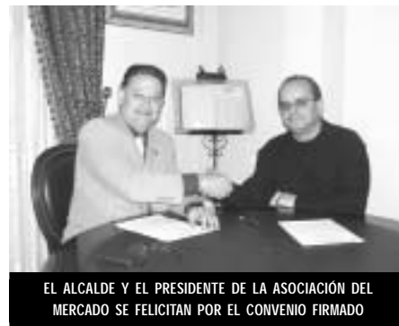
EL ALCALDE Y EL PRESIDENTE DE LA ASOCIACIÓN DEL MERCADO SE FELICITAN POR EL CONVENIO FIRMADO

Por otro lado, la Asociación de Comerciantes del Mercado de Abastos, que realiza distintas actividades para promocionar sus productos, en cam-