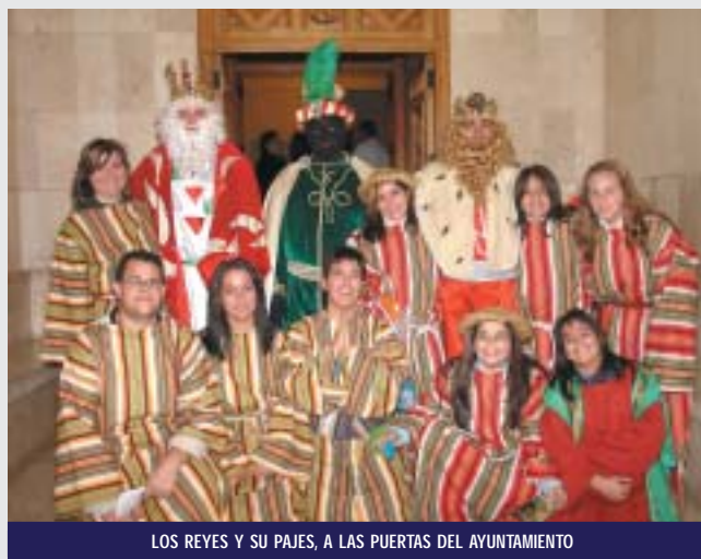
LOS REYES Y SU PAJES, A LAS PUERTAS DEL AYUNTAMIENTO

Los niños pinoseros enviaron sus cartas a SS.MM. los Reyes de Oriente, quienes atendieron sus peticiones y llegaron a Pinoso, en la tarde del 5 de enero, con un gran cargamento de regalos. Había que ver las caras de los niños al ver pasar a los Reyes en la gran cabalgata que recorrió las calles de Pinoso, hasta finalizar en el Templo Parroquial, con la adoración al Niño Jesús. Después llegaría la consabida aventura de saber qué regalos habían traído a niños y grandes.