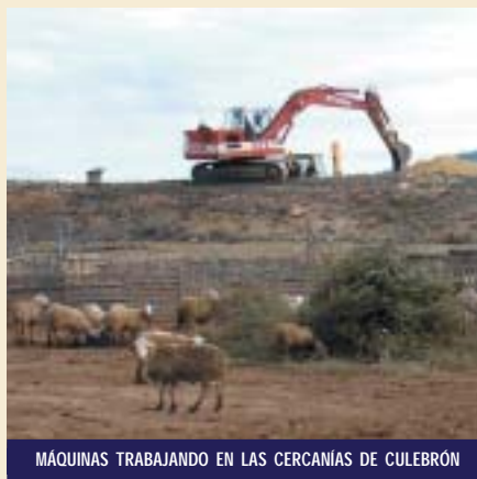
MÁQUINAS TRABAJANDO EN LAS CERCANÍAS DE CULEBRÓN

Para los habitantes de este rincón del municipio, estas obras son muy esperadas, ya que acabarán con la situación actual que padecen, al tener que hacer uso de pozos ciegos, cuyo man-