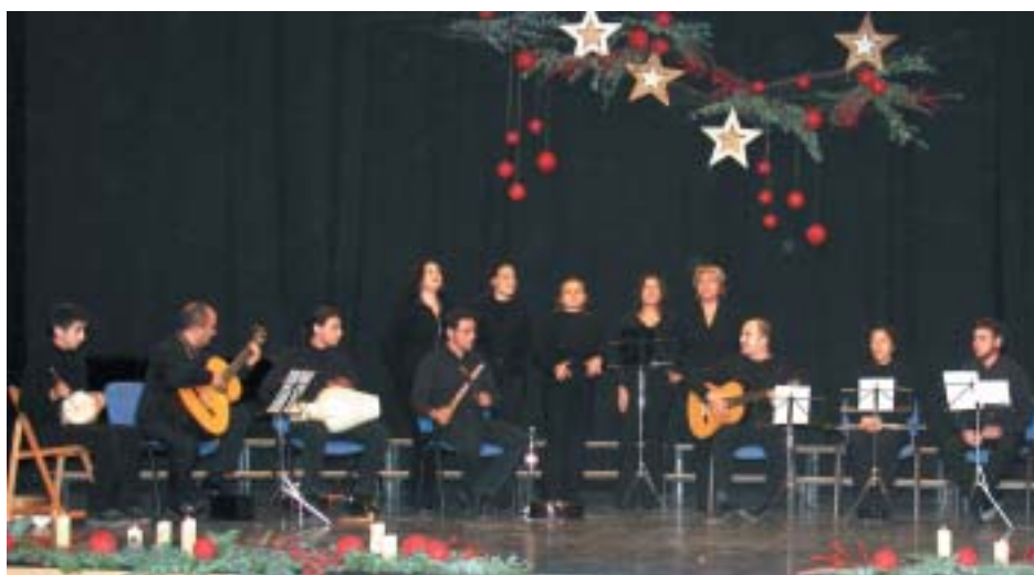
UN MOMENTO DE LA ACTUACIÓN DEL "GRUP DE DANSES DEL PINÓS"