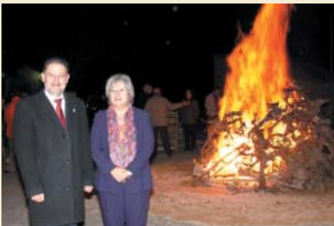
EL ALCALDE DE PINOSO Y LA PEDÁNEA DE UBEDA, JUNTO A LA HOGUERA DE SANTA BÁRBARA