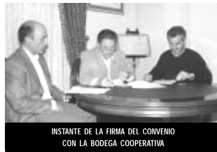
INSTANTE DE LA FIRMA DEL CONVENIO CON LA BODEGA COOPERATIVA

paññas como la de Navidad, también selló un nuevo convenio el pasado 19 de diciembre, percibiendo una ayuda de 5.000 euros.