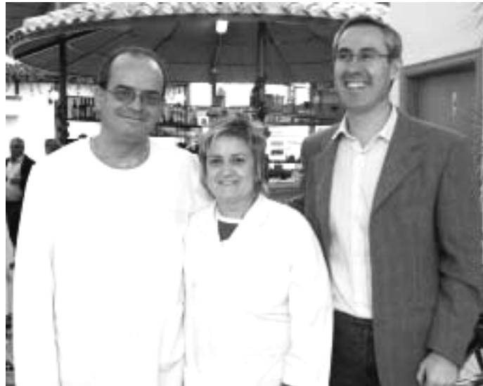
LA GANADORA DEL PREMIO ESPECIAL CON EL PRESIDENTE Y EL CONCEJAL DE MERCADO

Las dos asociaciones de comerciantes de nuestra localidad premiaron a sus clientes la confianza que depositan en ellos en sus respectivas campañas de Navidad.