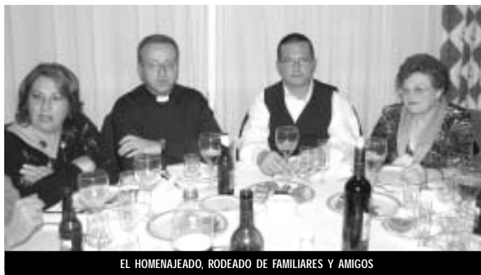
EL HOMENAJEADO, RODEADO DE FAMILIARES Y AMIGOS

La sociedad Pinós Benestar fue felicitada desde la Mancomunidad de la Vid y el Mármol por recoger el reto de la formación para sus empleados, y también elogió que el Ayuntamiento de Pinoso prestara su apoyo para que ello fuera posible.