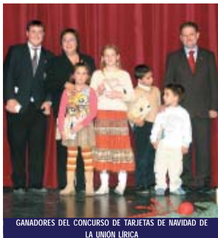
GANADORES DEL CONCURSO DE TARJETAS DE NAVIDAD DE LA UNIÓN LÍRICA

tas de Navidad. El acto finalizó con la actuación conjunta de todos los participantes cantando el villancico "San José al Niño Jesús".