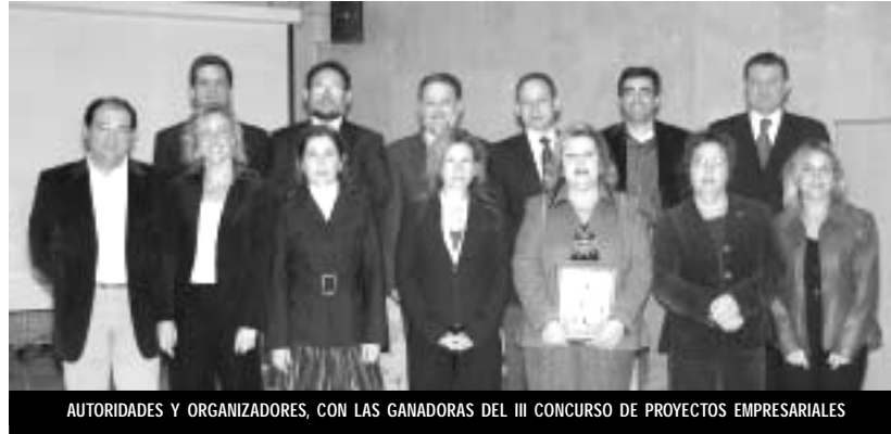
AUTORIDADES Y ORGANIZADORES, CON LAS GANADORAS DEL III CONCURSO DE PROYECTOS EMPRESARIALES

Al acto asistieron, además de autoridades locales y técnicos del Ayuntamiento, los representantes de los organismos provinciales que han ayudado a la creación y seguimiento de estos premios, y también representantes de la Asociación de Comerciantes de Pinoso ACP, que realizó una aportación de 600 euros a estos premios.