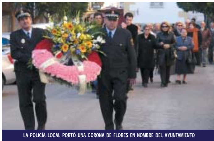
LA POLICÍA LOCAL PORTÓ UNA CORONA DE FLORES EN NOMBRE DEL AYUNTAMIENTO