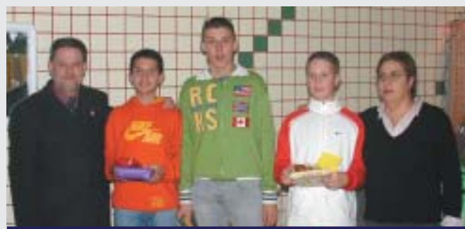
ENTREGA DE PREMIOS EN LA «FESTA NADALENCA»

Concluyeron las fiestas con la realización de una divertida gymkana, el día después de Reyes.