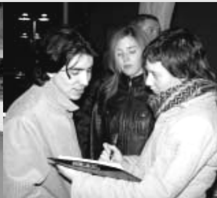
LOS JÓVENES COLABORARON RESPONDIENDO A UNA ENCUESTA