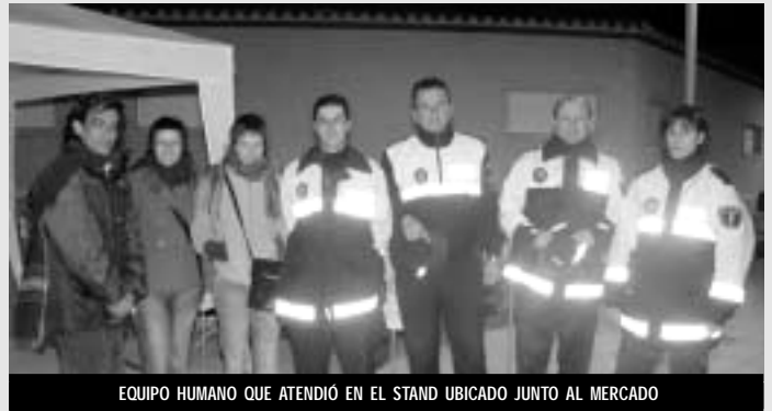
EQUIPO HUMANO QUE ATENDIÓ EN EL STAND UBICADO JUNTO AL MERCADO

En la primera jornada, en la noche del viernes 16, en los diferentes locales de ocio se proyectaron videos de la DGT, con imágenes reales de accidentes. Un día después, y en la Plaza Colón, monitores y agentes de la Policía, junto a miembros de Cruz Roja y Protección Civil, ofrecieron folletos informativos y realizaron encuestas y pruebas de alcoholemia, para constatar el grado de influencia por las bebidas alcohólicas. Otra de las actividades consistía en realizar fotografías, bajo el título "Esta podría ser la última foto de tu vida", junto a un vehículo siniestrado, en el que los viandantes también pudieron comprobar las consecuencias