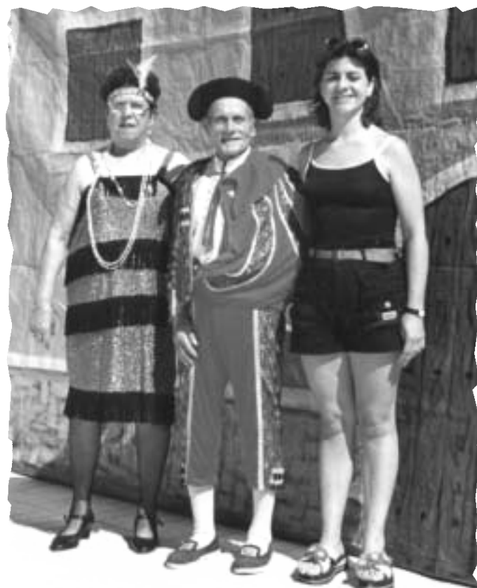
CODINO, TU FUISTE EL MÁS GRANDE...