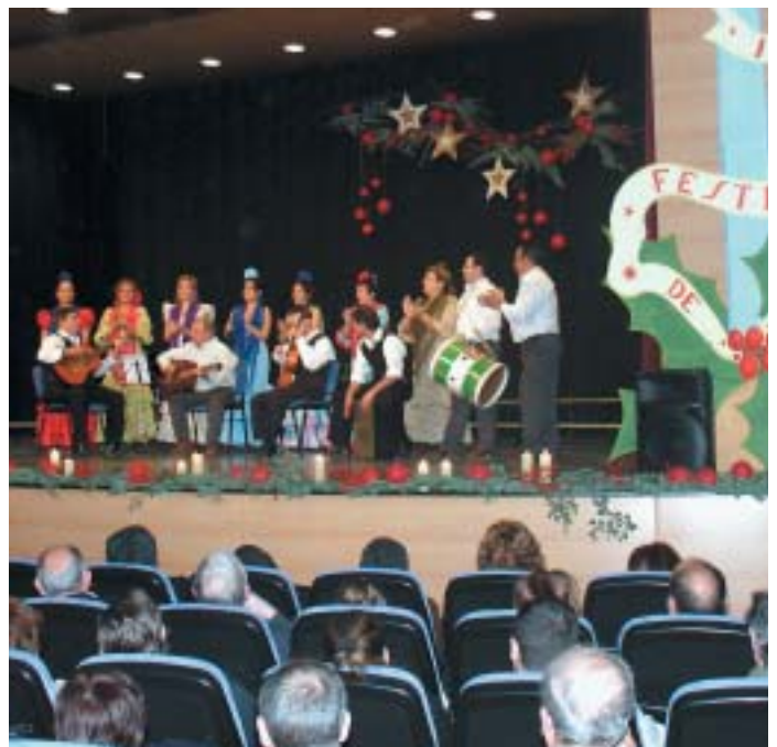
EL CANTE FLAMENCO TAMBIÉN ESTUVO PRESENTE GRACIAS AL GRUPO "ENTREPINAES"