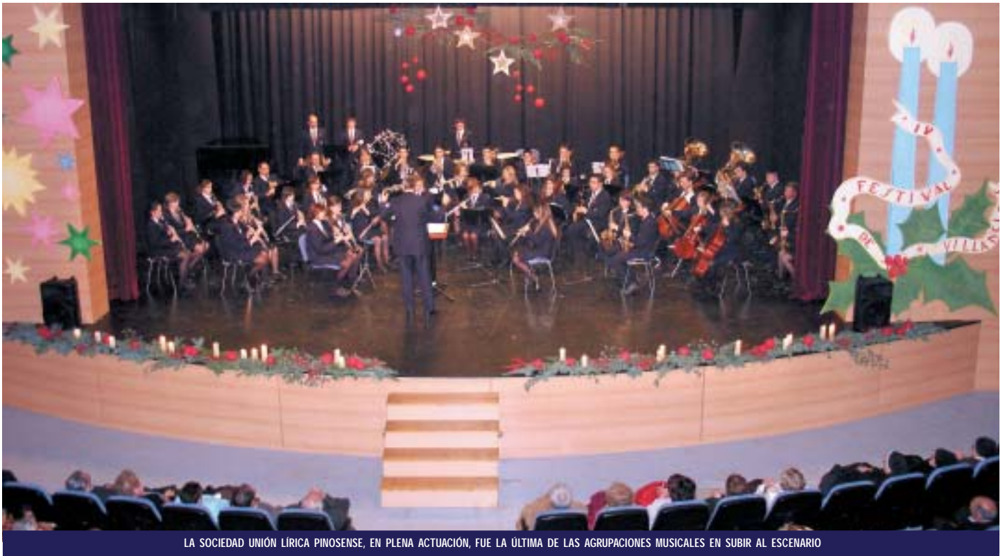
LA SOCIEDAD UNIÓN LÍRICA PINOSENSE, EN PLENA ACTUACIÓN, FUE LA ÚLTIMA DE LAS AGRUPACIONES MUSICALES EN SUBIR AL ESCENARIO