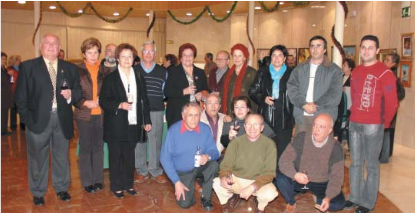
ARTISTAS QUE EXPUSIERON EN ESTA MUESTRA COLECTIVA DE PINOSART