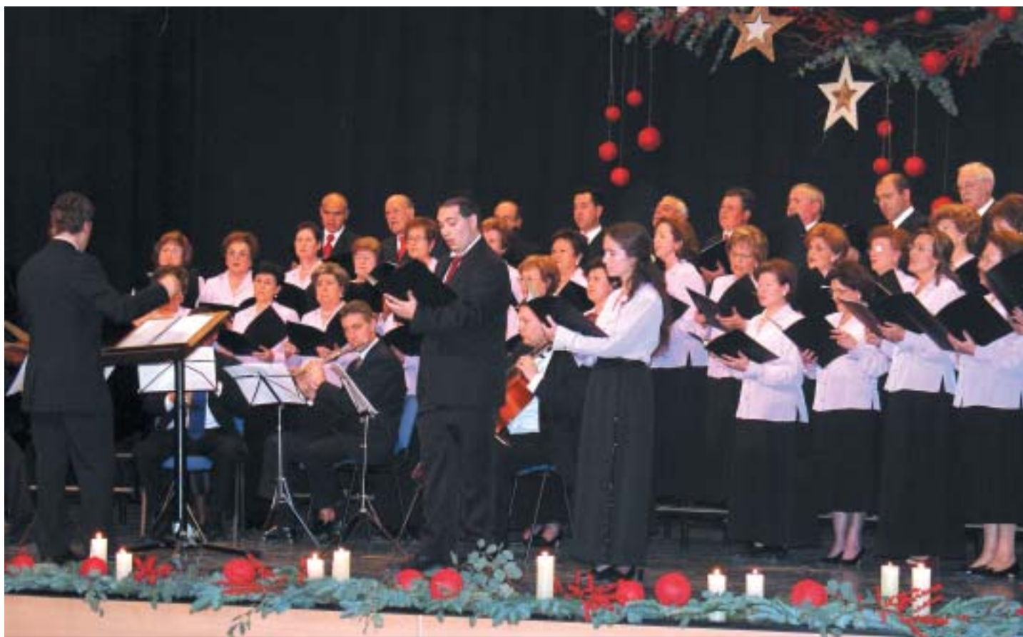
LOS ANFITRIONES DE ESTE AÑO, EL "CORO PARROQUIAL" EN UN MOMENTO DE LA ACTUACIÓN QUE OFRECIERON AL PÚBLICO CONGREGADO

Parroquial y la última en actuar la Sociedad Unión Lírica Pinosense. Destacar que el Coro Parroquial, organizador del evento en este 2005, contó con la colaboración de músicos y cantantes de ópera profesionales, lo que realzó aún más si cabe su actuación ante un público que respondió con gran ovación.