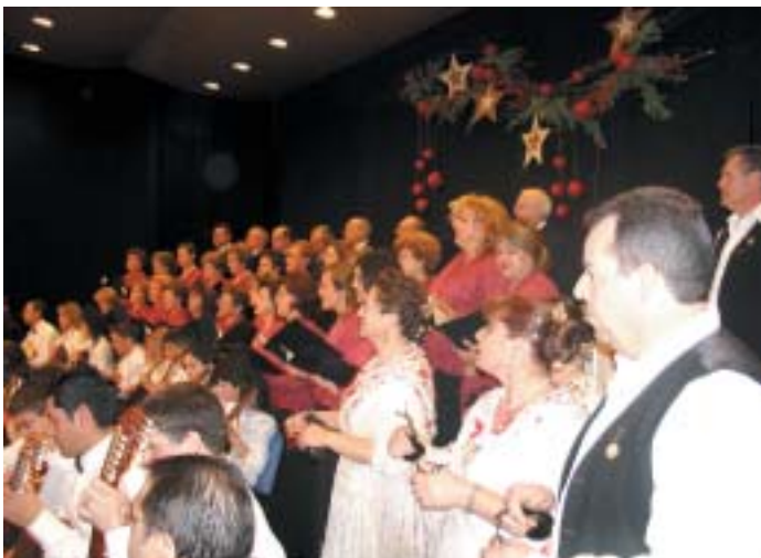
LOS SEGUNDOS EN SUBIR AL ESCENARIO FUE LA RONDALLA CORAL "MONTE DE LA SAL"