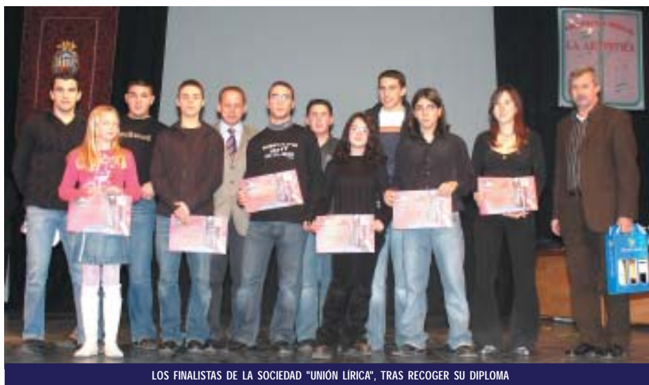
LOS FINALISTAS DE LA SOCIEDAD "UNIÓN LÍRICA", TRAS RECOGER SU DIPLOMA