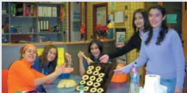
TALLER DE COCINA EN TOT JOVE

El Centro de ocio juvenil "Tot Jove" llevó a cabo, en el último mes del año, distintos talleres y actividades navideñas. Las actividades se desarrollaron en tres partes. La primera de ellas estuvo dedicada a la cocina navideña. Los jóvenes también participaron en un taller belenista, creando un Belén que estuvo expuesto en las instalaciones de Tot Jove.