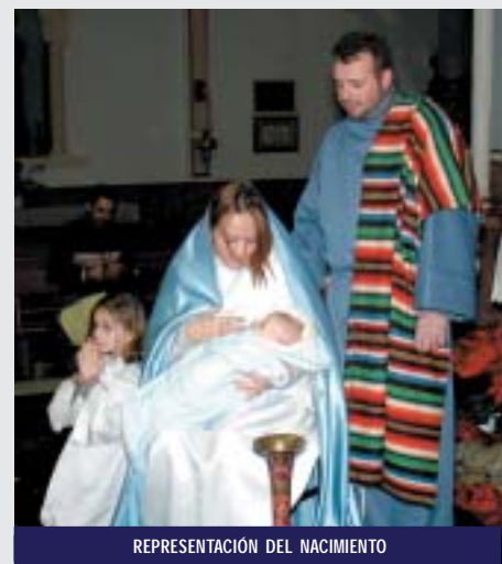
REPRESENTACIÓN DEL NACIMIENTO