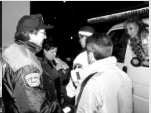
MUCHOS CONDUCTORES SE INTERESARON POR LA CAMPAÑA