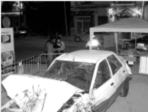
EL VEHÍCULO SINIESTRADO DE LA FOTO FORMABA PARTE DE LA CAMPAÑA

Esta campaña ha sido organizada por la Comisión de Educación Vial del Alto y Medio Vinalopó, con el fin de promocionar la opción del conductor alternativo (conductor 0,0º). Con ello, se pretende buscar fórmulas comunes y experiencias para la prevención de los accidentes de tráfico, la educación y la seguridad vial, así como concienciar a los jóvenes en los peligros de la conducción, el abuso de ingestión de alcohol y el binomio Alcohol-Conducción.