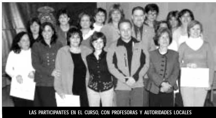
LAS PARTICIPANTES EN EL CURSO, CON PROFESORAS Y AUTORIDADES LOCALES

Auxiliares de ayuda a domicilio del Ayuntamiento de Pinoso tomaron parte en un curso de formación sobre esta ocupación, que se llevó a cabo en nuestra localidad, impartido por la S.L. Pinós Benestar, para cualificar a los auxiliares de ayuda a domicilio de su empresa.