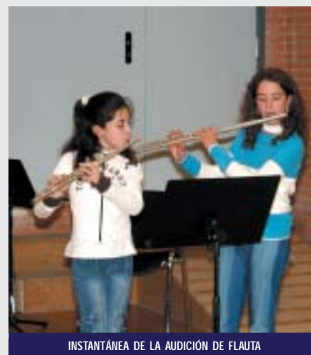
INSTANTÁNEA DE LA AUDICIÓN DE FLAUTA

bre con la audición de piano. Las actividades se llevaron a cabo en la sala de ensayos de la Casa de la Música, a excepción de la de piano, que tuvo lugar en el Teatro-Auditorio.